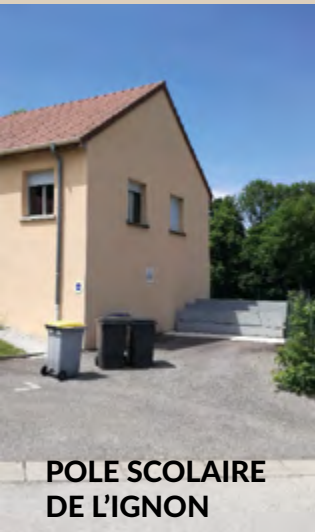
POLE SCOLAIRE DE L'IGNON