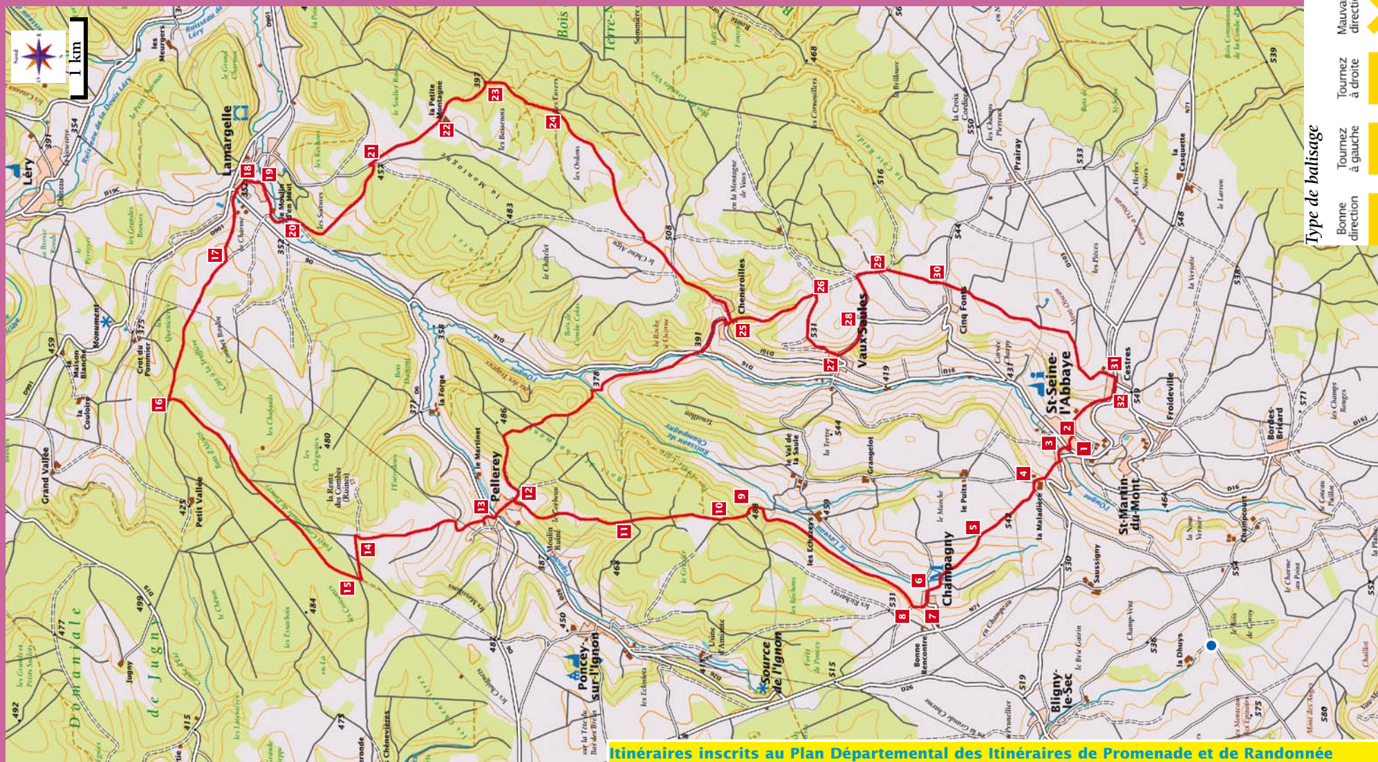
Itinéraires inscrits au Plan Départemental des Itinéraires de Promenade et de Randonnée

Toute reproduction ou adaptation, sous quelque forme et par quelque procédé que ce soit, même partielle, interdite pour tous pays.